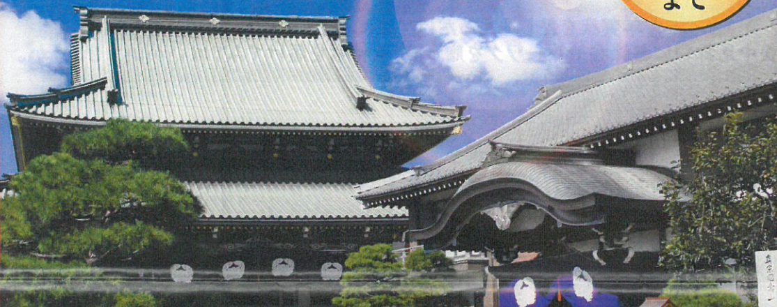
西善寺境内風景 歴史と風格として信頼を兼ね備えた 由緒ある寺院墓苑。

チラシ期間限定特典 このチラシご持参で、ご成約の御客様 石碑工事代100万円以上(税別) 100,000円引き 石碑工事代200万円以上(税別) 200,000円引き ※新区画お申し込みの上、石碑工事ご成約の方に限ります。(永代使用料除く)