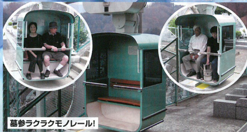
墓参ラクラクモノレール!