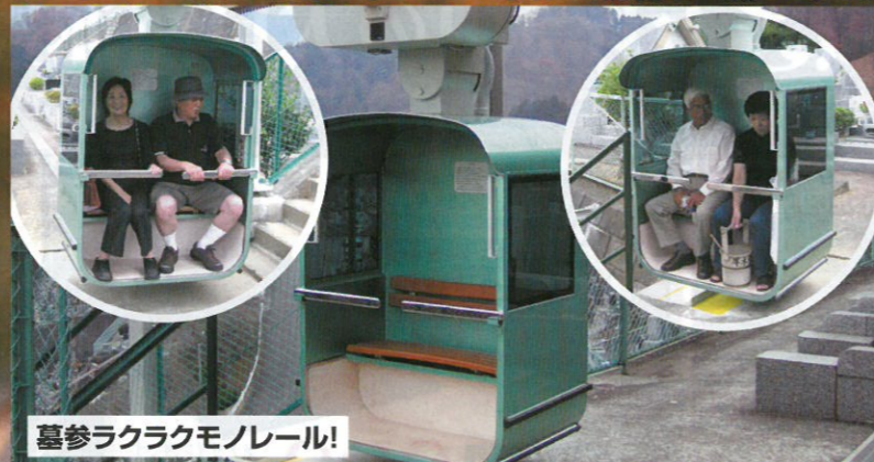
墓参ラクラクモノレール!