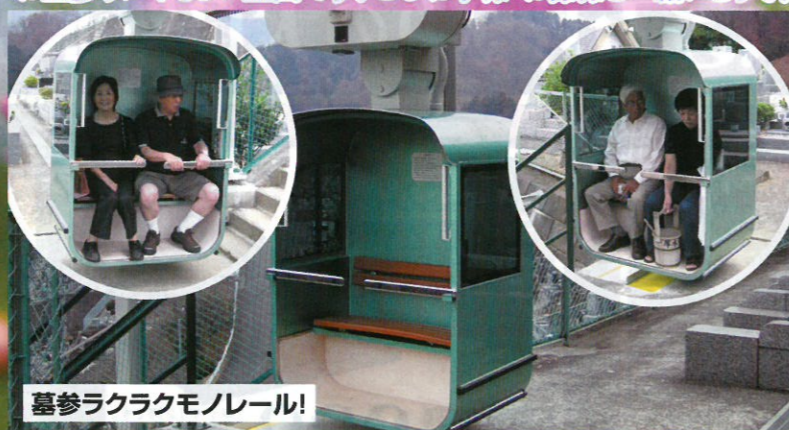
墓参ラクラクモノレール!