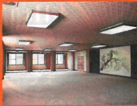
本堂1階広間 斎場として御使用になれます。