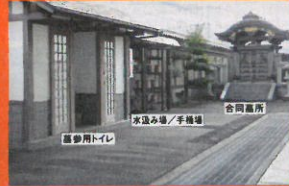
充実した設備 お参りの際お気軽にご利用ください。