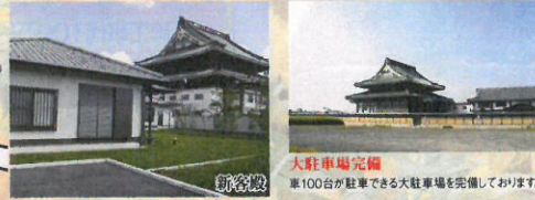
大駐車場完備 車100台が駐車できる大駐車場を完備しております。