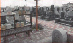
墓苑は本堂に隣接 隔当りのよい静かな環境です。 丹沢連那が一望できます。