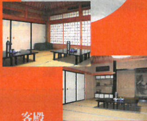
客殿 御法事のひとときを控室として御使用になれます。